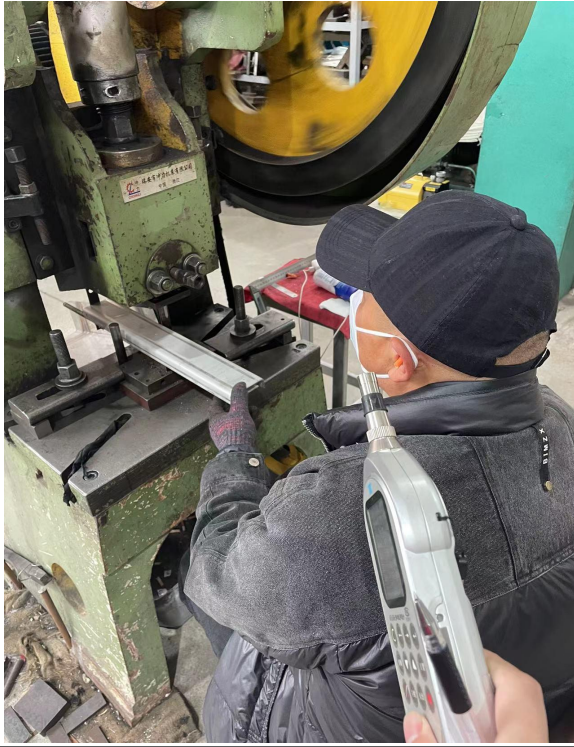
生产车间冲床岗位